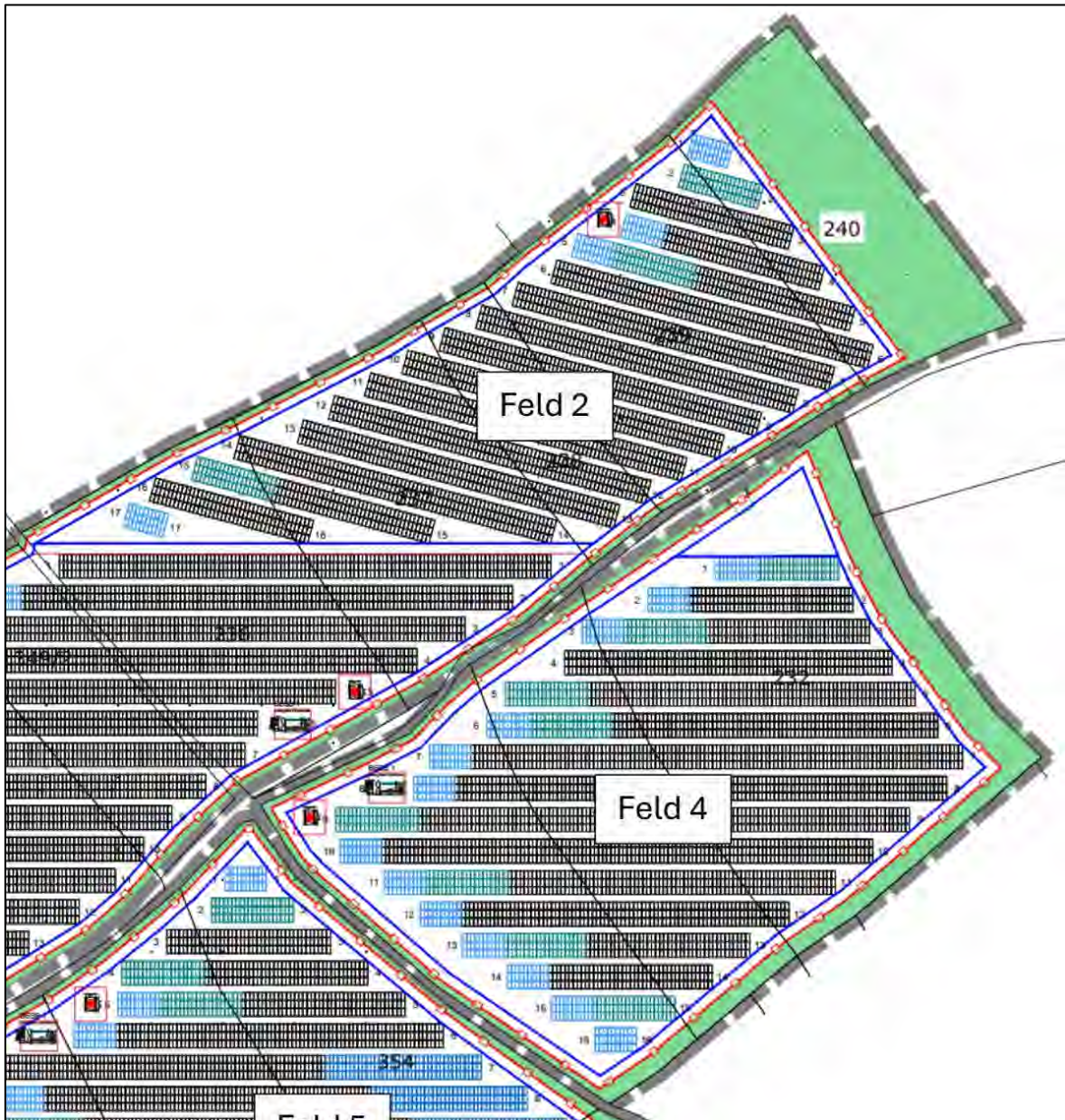
Abbildung 2: Auszug aus dem Modullayout „Hohenwart I“ (Feld 2+4), Planstand vom 21.01.2026

Im Nordosten der Modulflächen innerhalb der Teilfläche 3 wird eine weitere Trafostation sowie ein Batteriespeicher mit einer zugehörigen Wechselrichterstation angeordnet (siehe Abbildung 3).