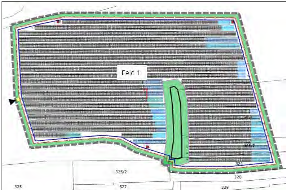
Abbildung 1: Auszug aus dem Modullayout „Hohenwart I“ (Feld 1), Planstand vom 21.01.2026, Planzeichner: Anumar GmbH