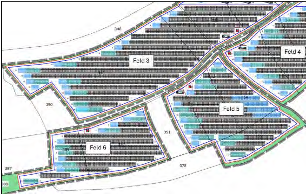
Abbildung 3: Auszug aus dem Modullayout „Hohenwart I“ (Feld 3 + 5 + 6), Planstand vom 21.01.2026, Planzeichner: Anumar GmbH

In Teilfläche 5 wird an der nordwestlichen Baugrenze ein weiterer Trafo, ein Batteriespeicher und die zugehörige Wechselrichterstation installiert.