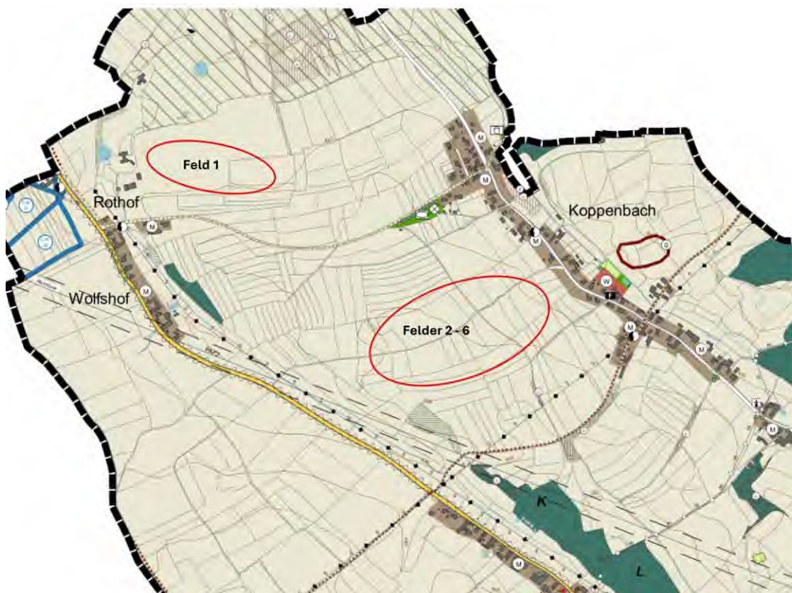
Abbildung 4: Auszug aus dem rechtskräftigen Flächennutzungsplan (Bereich: „Solarpark Hohenwart I“) des Marktes Hohenwart

Die unmittelbar angrenzenden Flächen werden ebenso landwirtschaftlich genutzt. Im Südwesten der Teilfläche 1 befinden sich im Abstand von mindestens 60 m Wohnbebauungen in den Weilern Rothof und Wolfshof, welche gemäß dem Flächennutzungsplan als Dorfgebietsflächen einzustufen sind (siehe Abbildung 4).