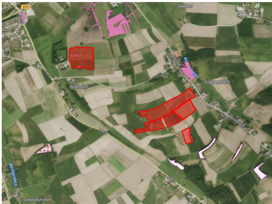
Abbildung 1: Auszug aus Biotopkartierung

Das Biotop Nr. 7434-0039 „Hohlwege südlich Koppenbach“ liegt mit 87 m Entfernung südlich des Geltungsbereiches 4 und direkt angrenzend zu Geltungsbereich 6.