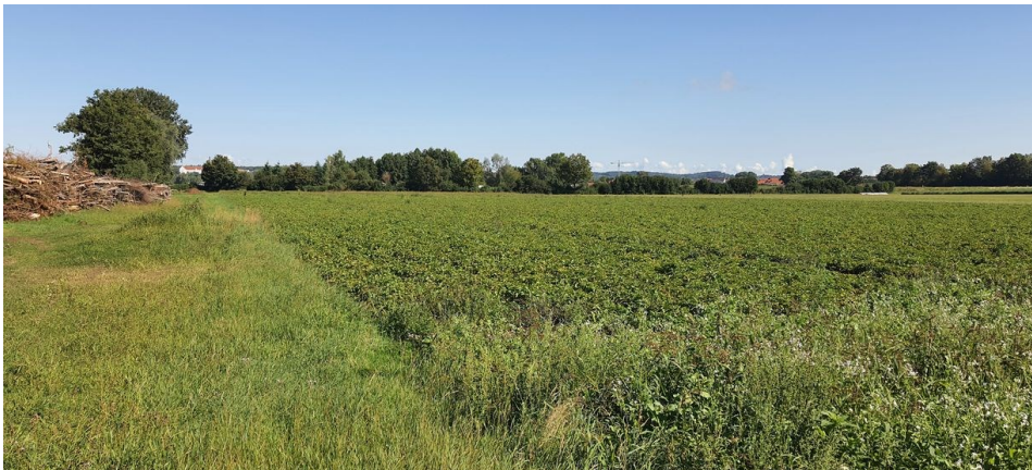
Foto 2: Östliche Teilfläche, Blick nach Norden – Gehölzreihe (nach Rückschnitt) mit Grünlandstreifen und Kartoffelacker