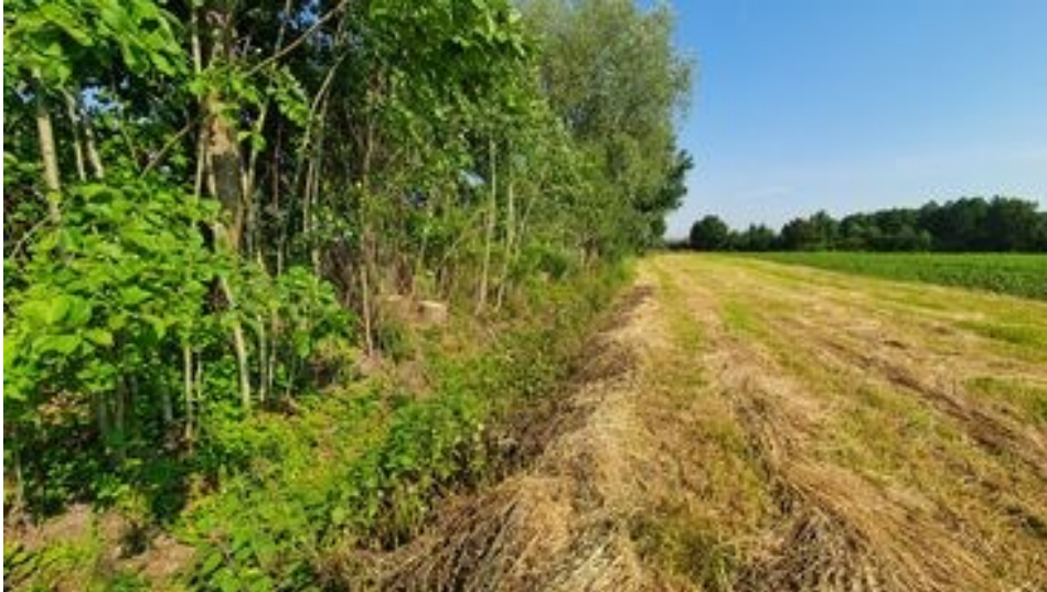
Foto 1: Östliche Teilfläche, Blick nach Norden – Gehölzreihe (nach Rückschnitt) mit Grünlandstreifen