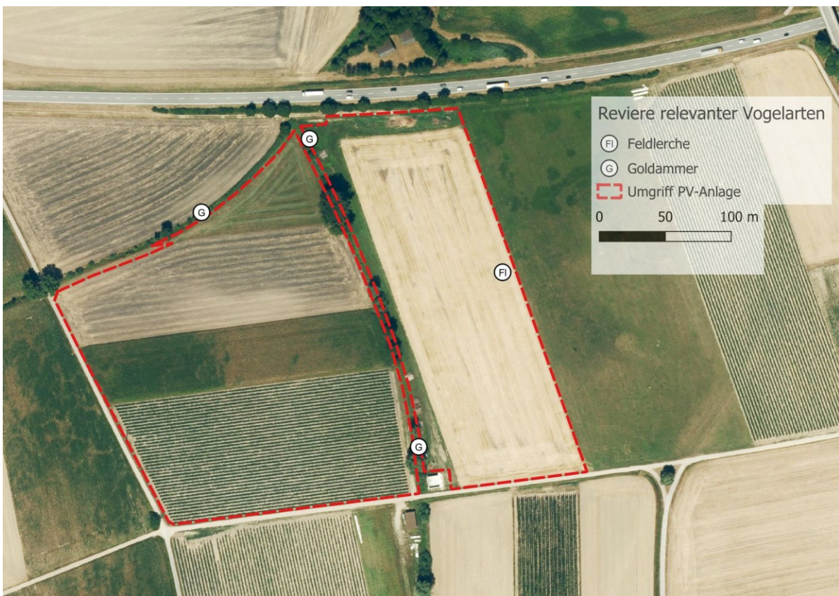
Karte 3: Lage von Revieren relevanter Vogelarten (Kartengrundlage: Bayerische Vermessungsverwaltung – www.geodaten.bayern.de )

Bei der Goldammer und Arten mit ähnlichen Habitatansprüchen sind erhebliche temporäre Beeinträchtigungen und vermutlich auch Tötungen und Verletzungen von Individuen (v.a. Gelege und Jungvögel) während der Baumaßnahmen möglich. Zur Vermeidung von Verbotstatbeständen ist daher zwingend eine Reduzierung und Vermeidung von Beeinträchtigungen im Bereich der Gehölze durch einen ausreichenden Abstand der Module notwendig.