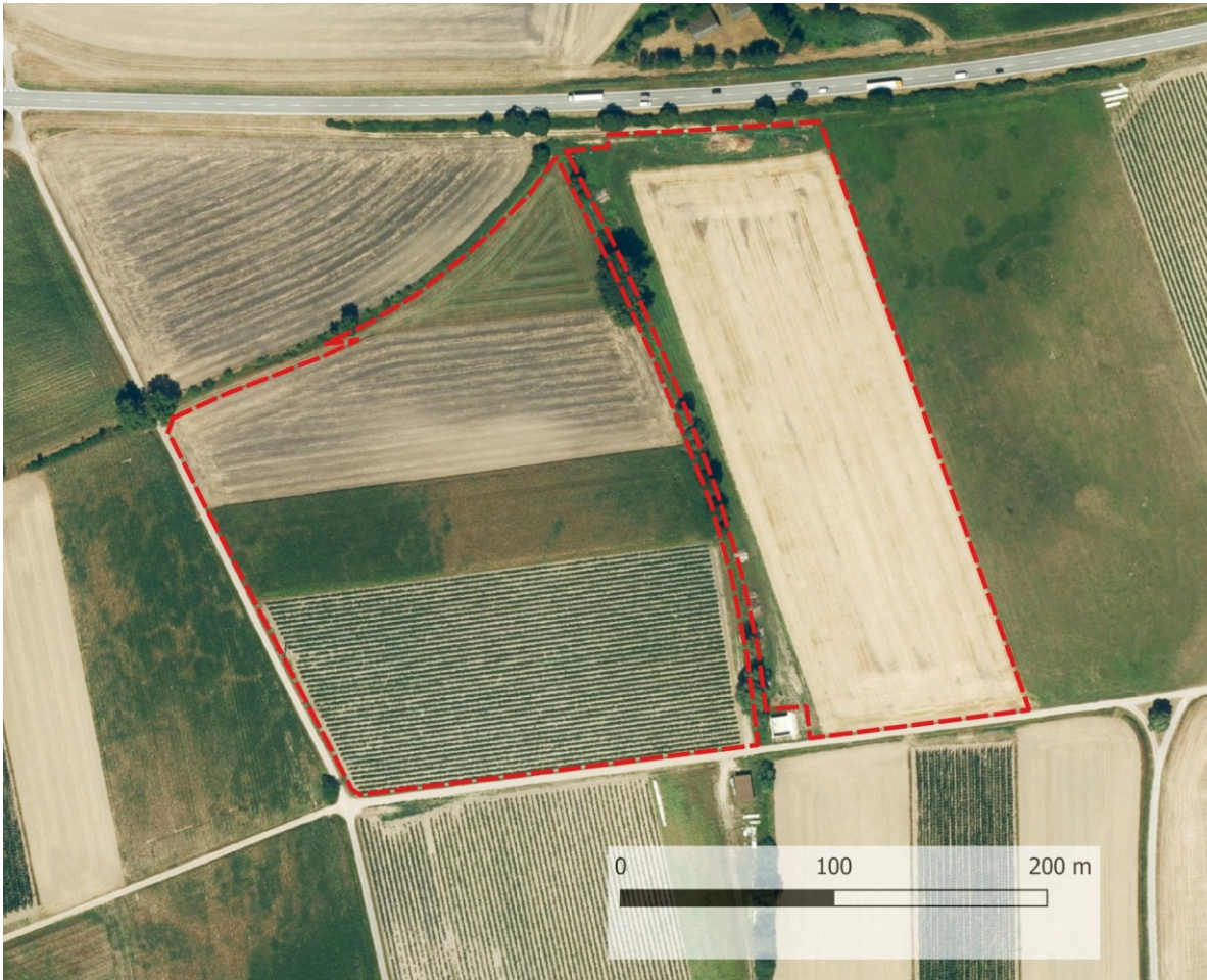
Karte 2: Grenzen des geplanten Solarparks