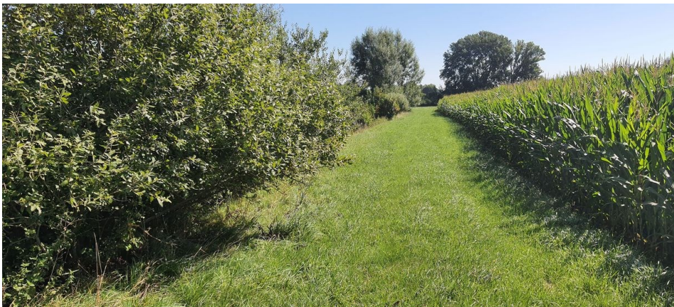
Foto 3: Westliche Teilfläche, Blick nach Osten – Graben mit Gehölzen und Maisacker