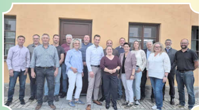
Die Gemeinderäte 2026 bis 2032 des Marktes Hohenwart