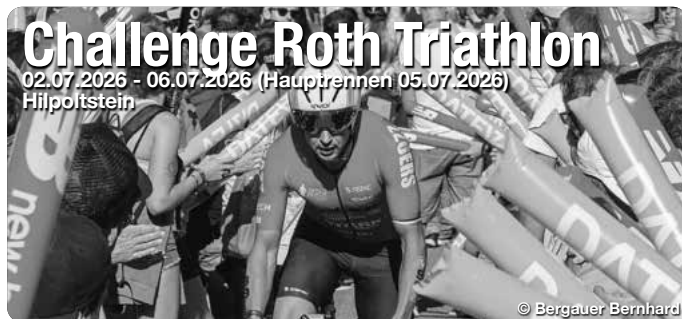
Challenge Roth Triathlon 02.07.2026 - 06.07.2026 (Hauptrennen 05.07.2026) Hilpoltstein

Lebendiges Geschichtsdorf Landersdorf Hier erfährt man hautnah anhand originalgetreuen Rekonstruktionen eines Steinzeit-, eines Kelten- und eines Bajuwarenhauses, wie unsere Vorfahren in Süddeutschland vor 1.200, 2.500 oder 5.000 Jahren gelebt haben. Landersdorf 28, Thalmässing