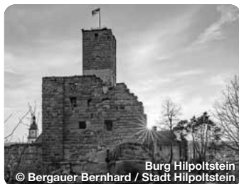
Burg Hilpoltstein