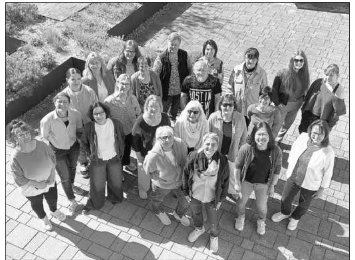
Foto der diesjährigen Teilnehmer*innen an der Schulung im April 2026

Besonders schön: Auch hier vor Ort gibt es Alltags- und Demenzhelfer*innen , die sich engagieren und unterstützen – ganz nah, verlässlich und mit Herz.