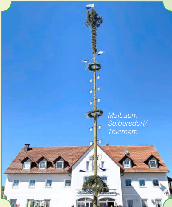
Maibaum Seibersdorf/ Thierham

Der Markt Hohenwart freut sich, dass die Tradition des Maibaumaufstellens in unserer Gemeinde gepflegt und erhalten wird, und bedankt sich herzlich bei den Maibauminitiativen für die schönen Maibäume und die tollen Feierlichkeiten.