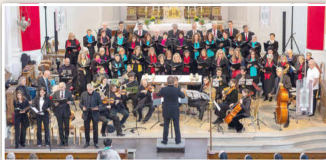
Der Hohenwarter Kirchenchor samt Solisten und Orchester begeisterte in der Pfarrkirche St. Georg mit einem abwechslungsreichen Programm – von klassischer Kirchenmusik bis hin zu moderner Rockmusik.