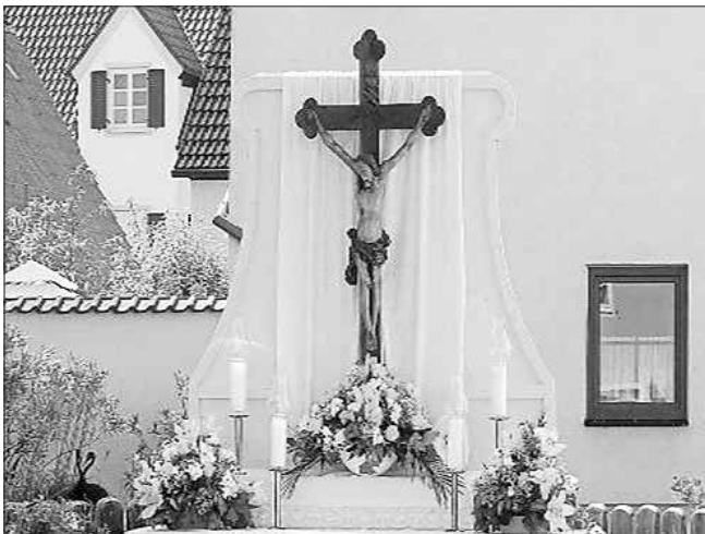
Pfarrgemeinderat der Pfarrei St.-Georg/Mariä Verkündigung und Marktgemeinde Hohenwart

Herzliche Einladung zum Festgottesdienst anlässlich des Hochfestes Fronleichnam am Donnerstag, 4. Juni 2026 um 8.30 Uhr in der der Marktkirche Mariä Verkündigung Hohenwart mit anschl. Prozession durch den Markt und Abschluss im oder (Wetterlage) beim Pfarrheim St. Georg – mit Würstel und Getränke.