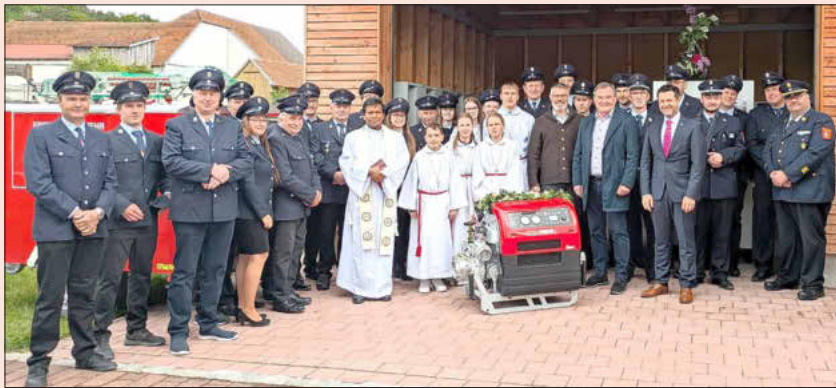
Die Feuerwehr Koppenbach mit Gästen vor der neuen Feuerwehrgarage mit der neuen Tragkraftspritze

300 Arbeitsstunden für die Sanierung des Feuerwehrhauses, 1.300 Arbeitsstunden für den Bau der nagelneuen Feuerwehrgarage – eine komplette Baumaßnahme in Eigenleitung! Der Fleiß und der Zusammenhalt in der Koppenbacher Feuerwehr ist wirklich bemerkenswert. Da ist es nur folgerichtig das nach getaner Arbeit auch gefeiert werden muss. Am Samstag, den 16.5.2026 war es soweit. Die Einweihungsfeier stand an, und unter den 150 geladenen Gästen fand sich auch ein illustrierter