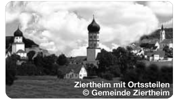
Zierthiem mit Ortsstellen

Die Stadt Gundelfingen a.d. Donau hat mit den Stadtteilen Peterswörth und Echenbrunn über 8.000 Einwohner. Das Stadtbild ist geprägt vom Mittelalter und erhielt im Jahr 1220 die Stadtrechte. TreffpunktDeutschland.de/gundelfingen