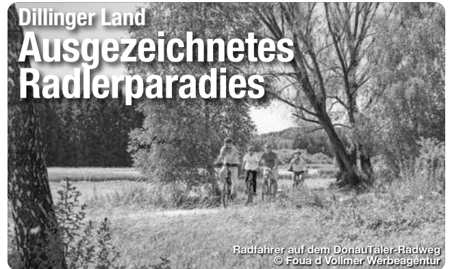
Radfahrer auf dem DONAUTÄLER-Radweg

Am besten lässt sich das vielfältige Dillinger Land mit dem Rad erkunden. Mehr als 15 abwechslungsreiche Tagestouren führen durch den landschaftlichen Dreiklang zwischen Alb, Donautal und Voralpenland – und machen die Region somit zu einem echten Paradies für Radfans. Radlergenuss pur bieten auch die beiden der 4-Sterne-Radwege Donautäler und Donauradweg. Ein besonderes Highlight ist der Radrundweg zu den Sieben Wegkapellen. Er verbindet auf 153 Kilometern sieben einzigartige Kapellenbauten miteinander – wahre architektonische Unikate und