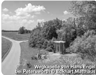
Wegkapelle von Hans Engel bei Peterswörth