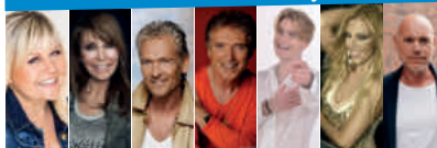
Gaby Baginsky, Ireen Sheer, Olaf Berger, Peter Orloff, Vincent Gross, Loona und Olaf Henning